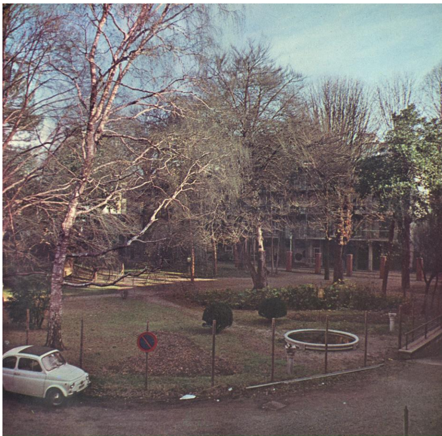
Immagine degli anni 70, con la scellerata creazione della rampa per le auto, che separerà villa e giardino fino ai giorni nostri.

Questi interventi in realtà non sono così catastrofici se si comparano con la decisione nel 1957 di realizzare una autorimessa comunale nel piano interrato dell'edificio contiguo al municipio. Questa opera si realizza con la costruzione di una rampa carrabile sul fronte nord della villa e ha come effetto gravissimo quello di separare irrimediabilmente la villa dal giardino.