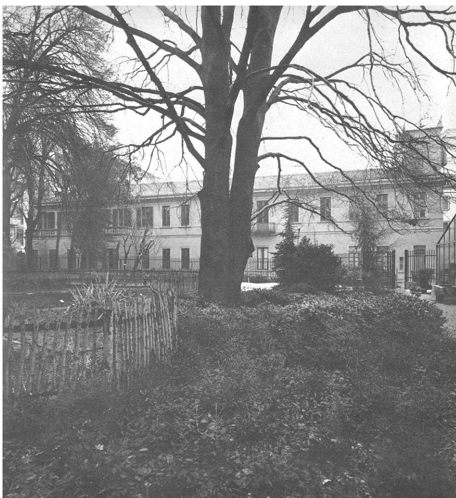
Facciata posteriore: albero abbattuto( da rilievo botanico)

Si susseguono senza una linea guida degli interventi sulla villa stessa con demolizioni di ali, cappuccine e aperture ritenute razionali verso la sede del municipio che si è insediato nella villa e verso l'asilo che precedentemente è stato costruito a margine del parco.