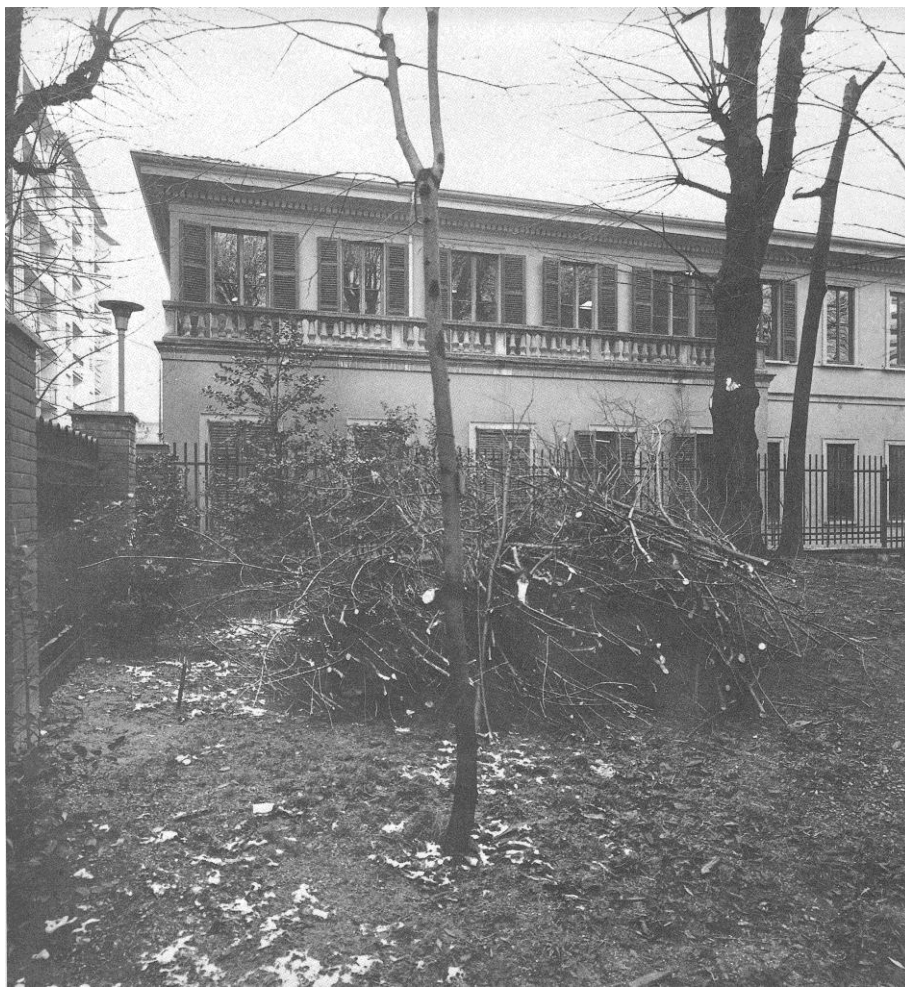
Facciata posteriore (ex facciata principale): sfalcio e potatura esistente.