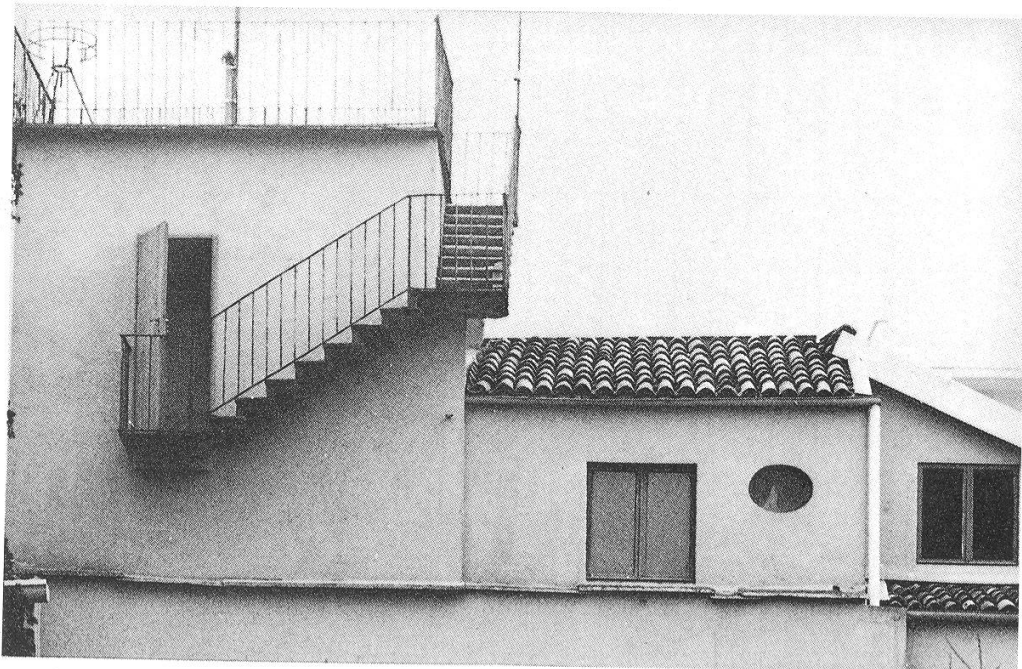
Torretta di barnaba oriani da lato.