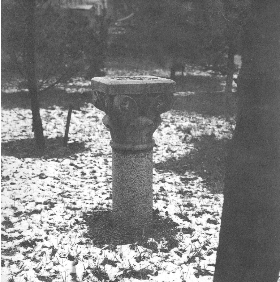
Antichità sparse per il parco, ora introvabili.